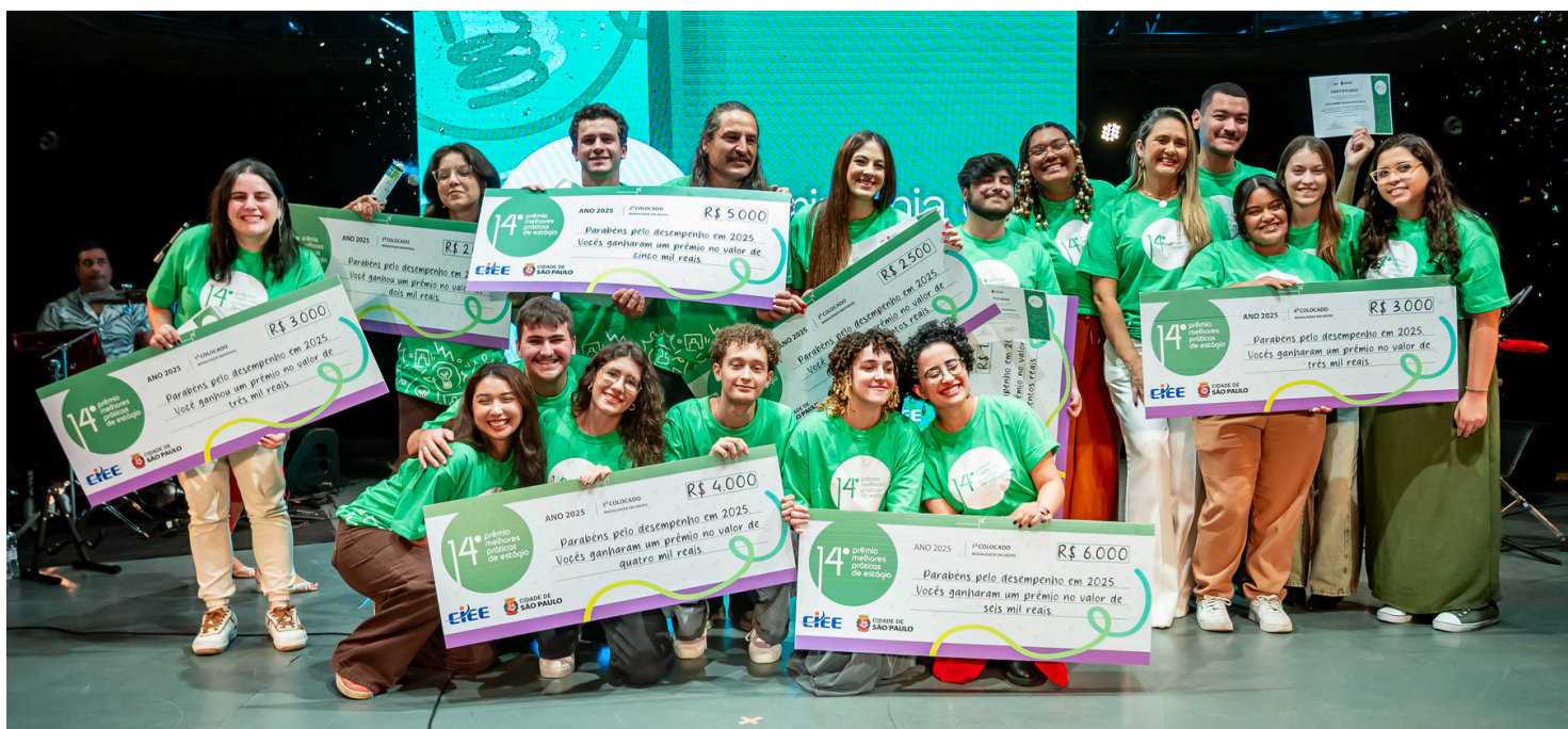
Finalistas do 14º Prêmio Melhores Práticas de Estágio exibem os certificados e cheques | 2025

Em cada edição são selecionados temas específicos para a adequação dos projetos participantes. Os(as) estagiários(as), que podem participar na categoria individual ou em grupo, concorrem a um prêmio em dinheiro. Próxima à data do evento de abertura, os estagiários serão avisados via e-mail pela Coordenação Geral de Estágios.